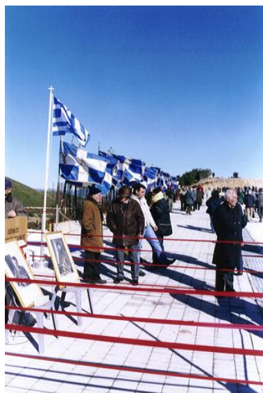
Τα λάβαρα των συνδέσμων Εθνικής Αντίστασης